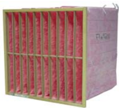
1. Hi-Flo Wood F7