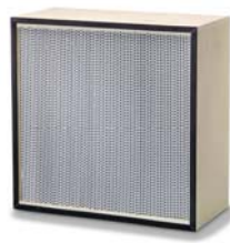
3. Super Absolute H13