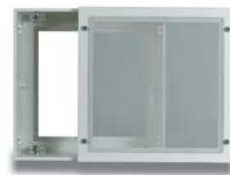
9. Sofdistri Reprise op aanvraag