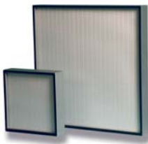
6. Megalam MDA