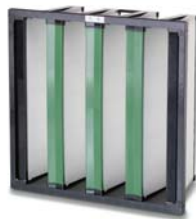
2. Opakfil Green F8